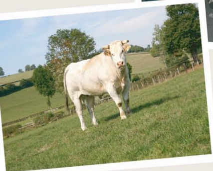
film en 3 D : les vaches au pré le marché de St Christophe en Brionnais