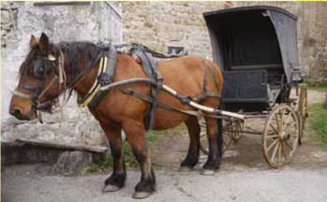
Calèche de la Belle Époque