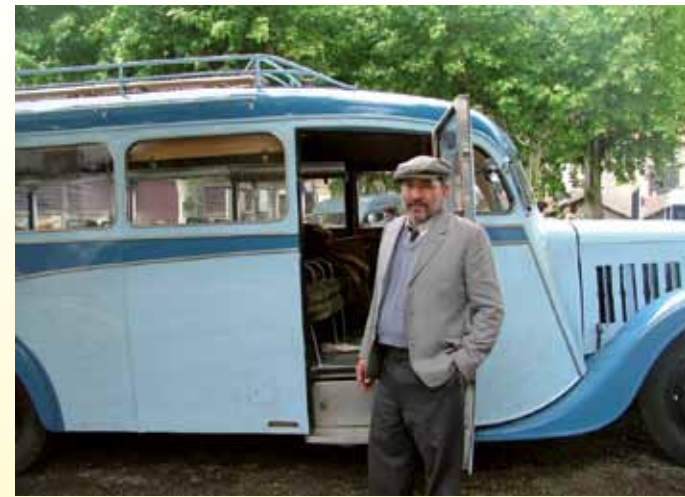
Le P32 ... une star de cinéma

(Visites spéciales pour les scolaires de tous niveaux : nous consulter).