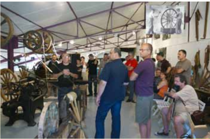
Un point fort : la visite guidée