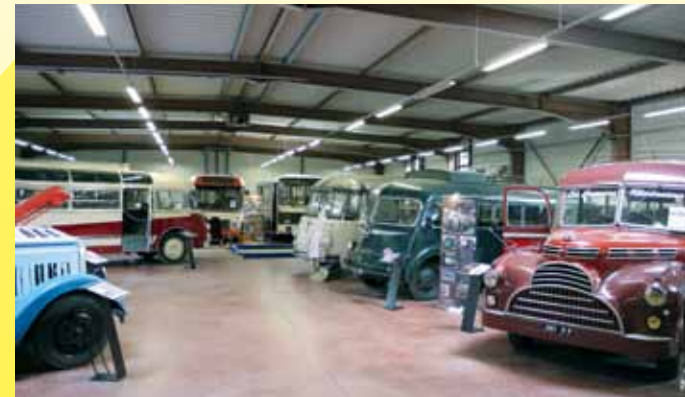
Une belle lignée ...