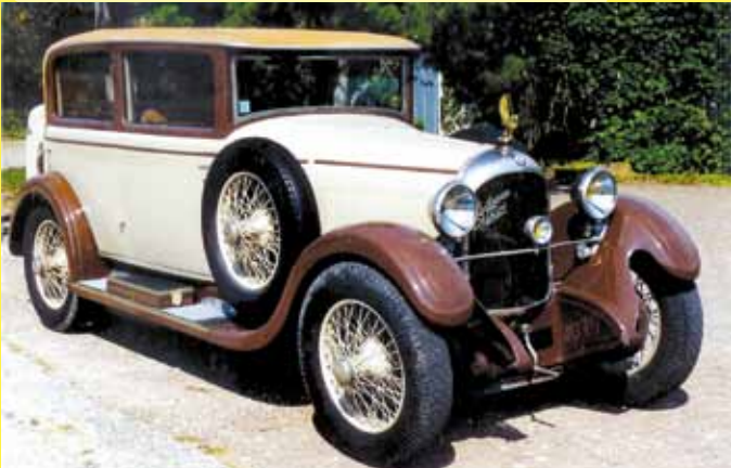
Rolland Pilain - 1929