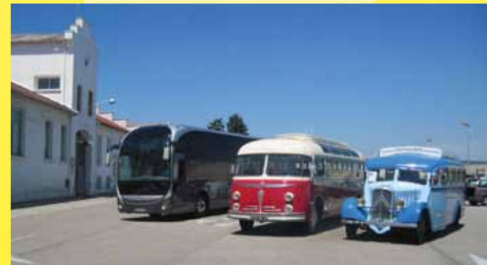
... Prélude à Magelys